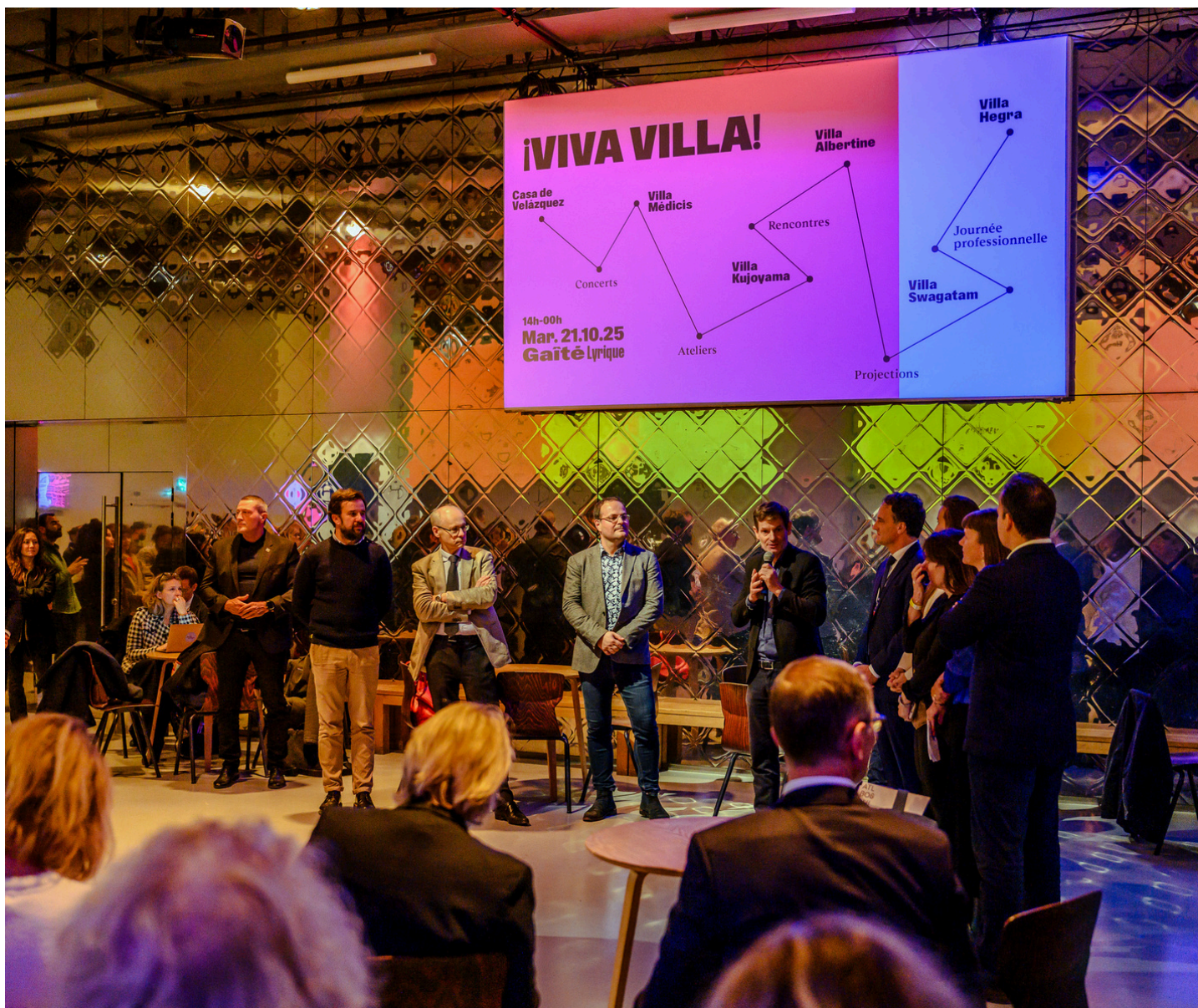
Rendez-vous annuel ¡Viva Villa!, le Mardi 21 octobre 2025 à la Gaité Lyrique