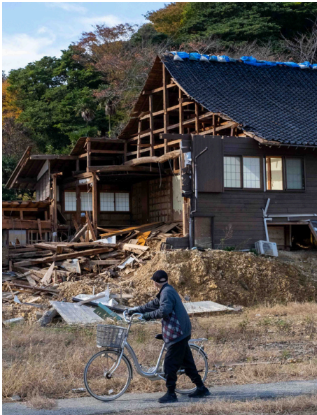
Péninsule de Noto

Plus d'informations sur : ma-lereseau.org et @reseaudesma