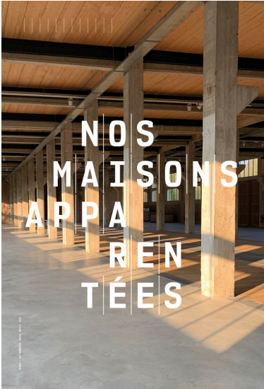
Vue de la Grande Halle, Les Tanneries Centre art contemporain d'intérêt national @Patrick H Müller Courtesy Les Tanneries CACIN Amilly

Plus d'informations sur : lestanneries.fr et @lestanneries_cacin