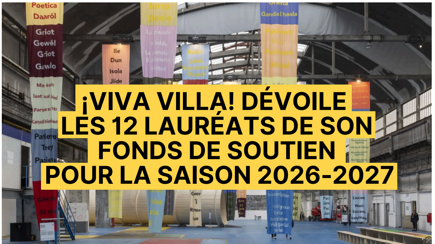
Murdesmots de Bocar Niang à la 17e biennale d'art contemporain de Lyon (2024)