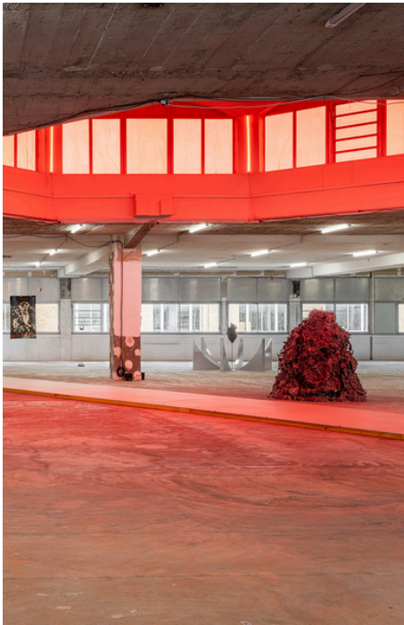
Rire sur un Volcan

Plus d'informations sur : poush.fr et @poush